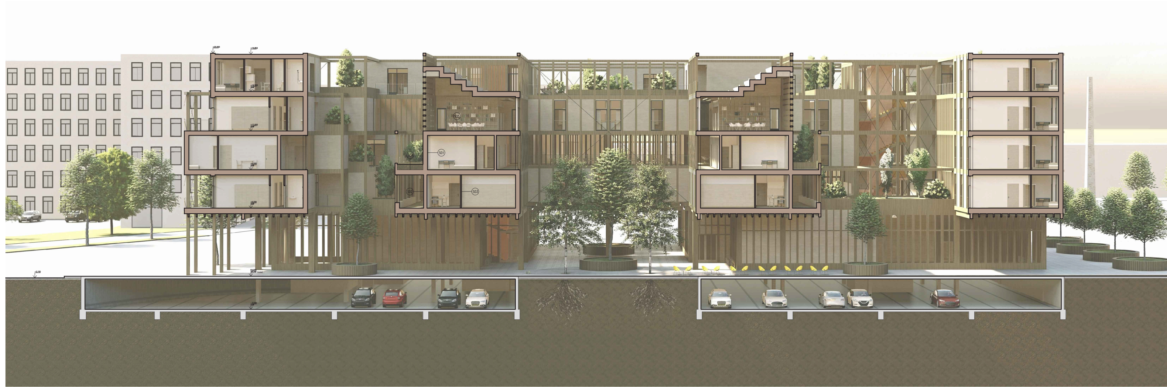
ŘEZ A-A' 1:200