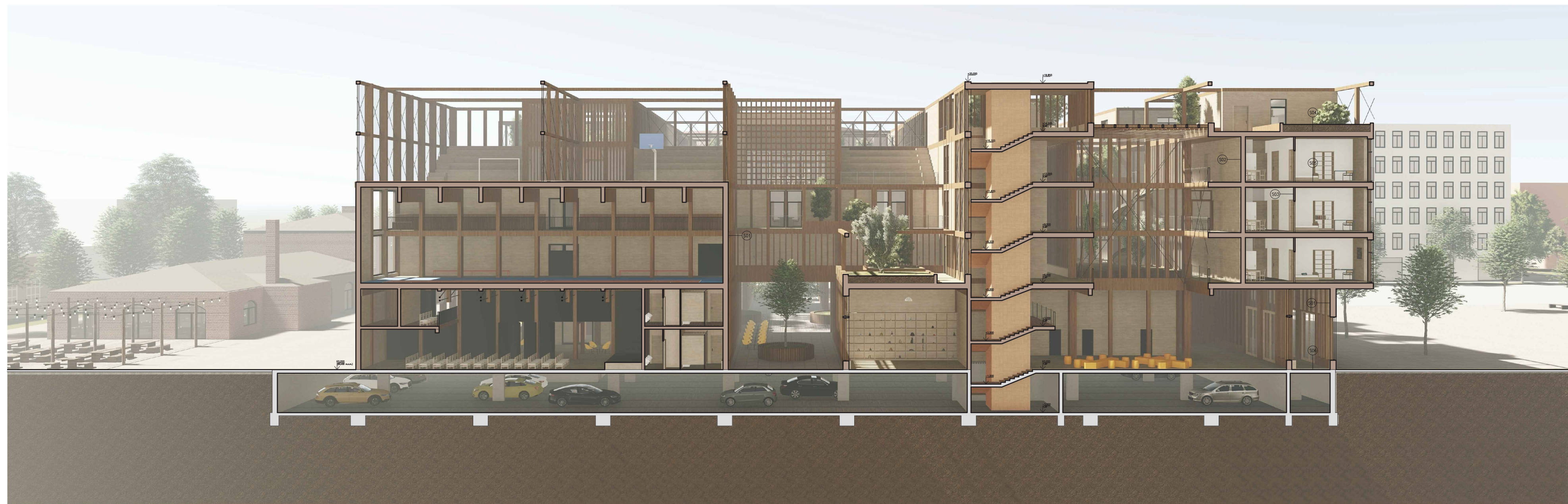
ŘEZ B-B' 1:200