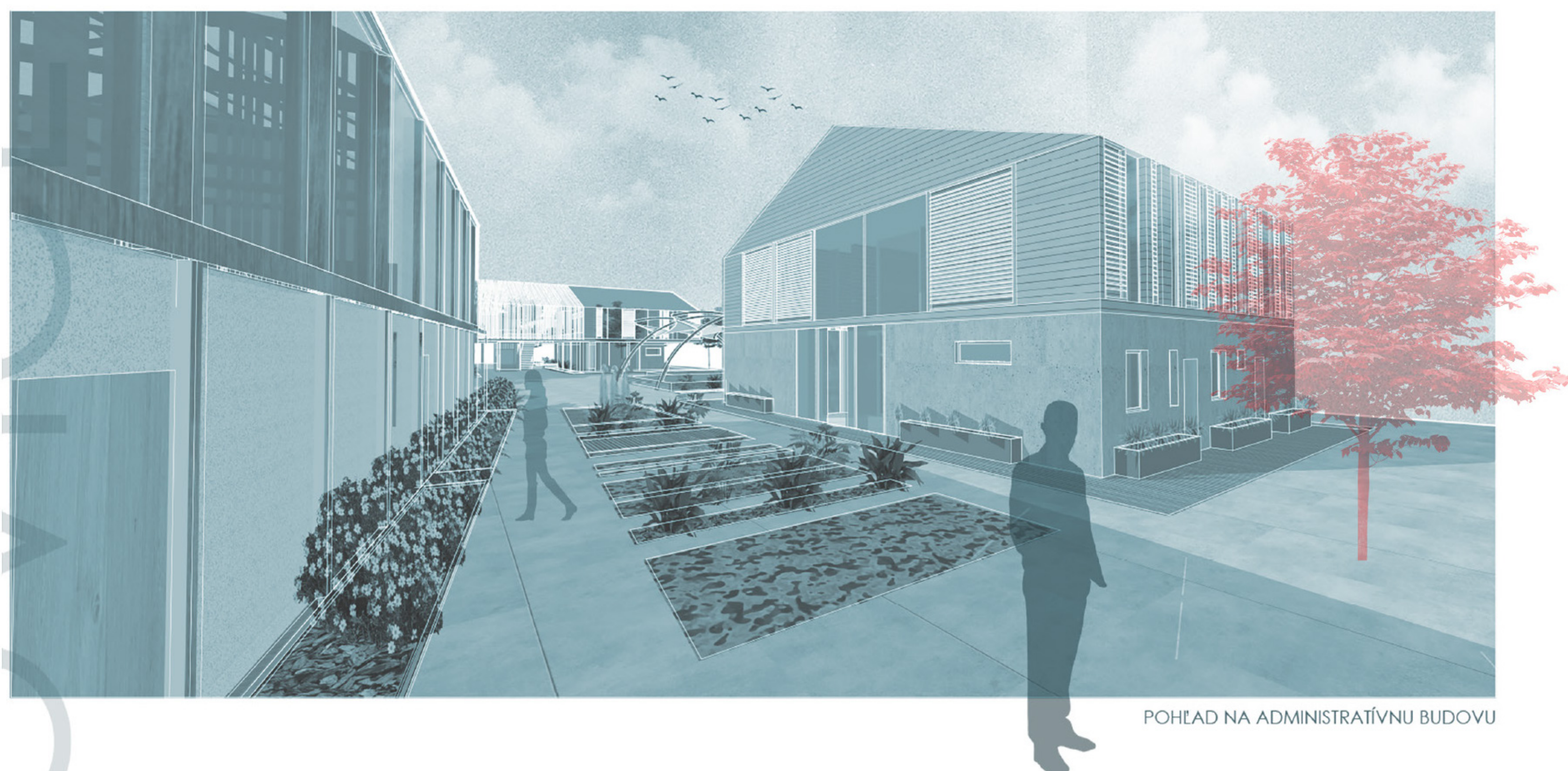
POHĽAD NA ADMINISTRATÍVNU BUDOVU