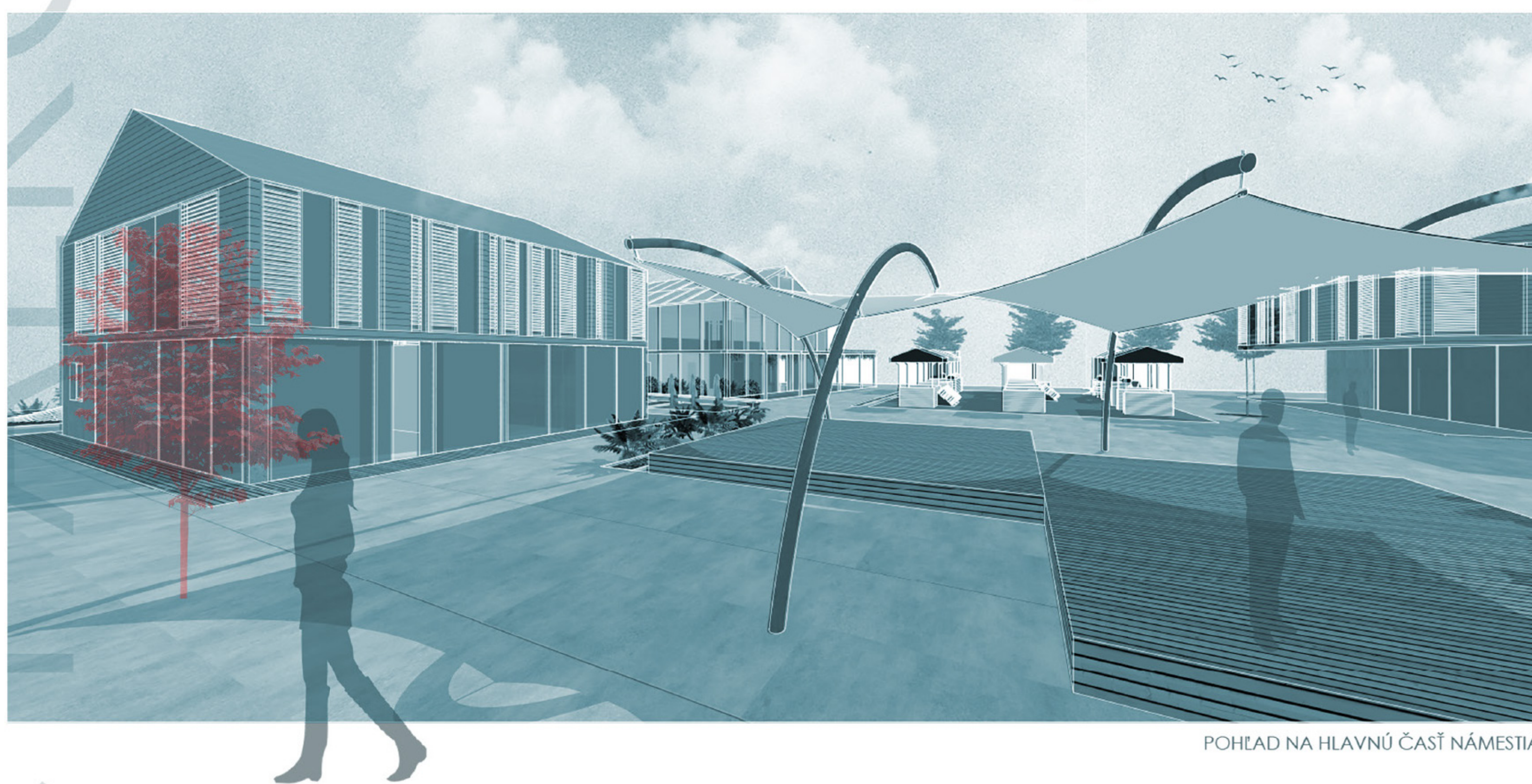
POHĽAD NA HLAVNÚ ČASŤ NÁMESTIA