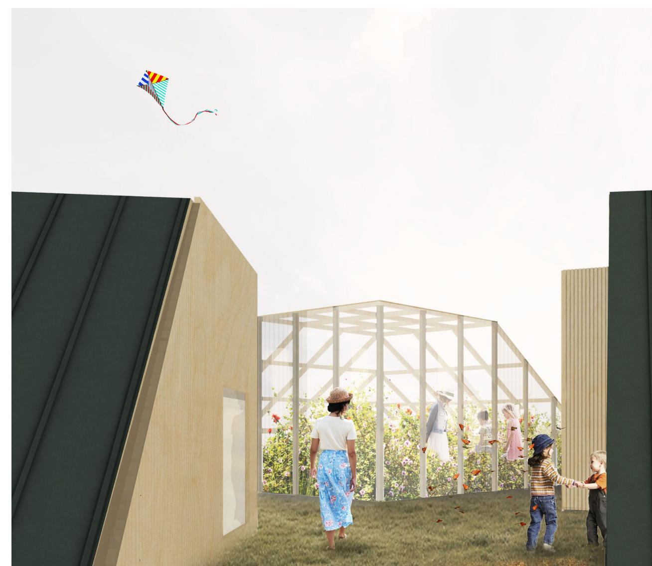
Pohled na střešní skleník