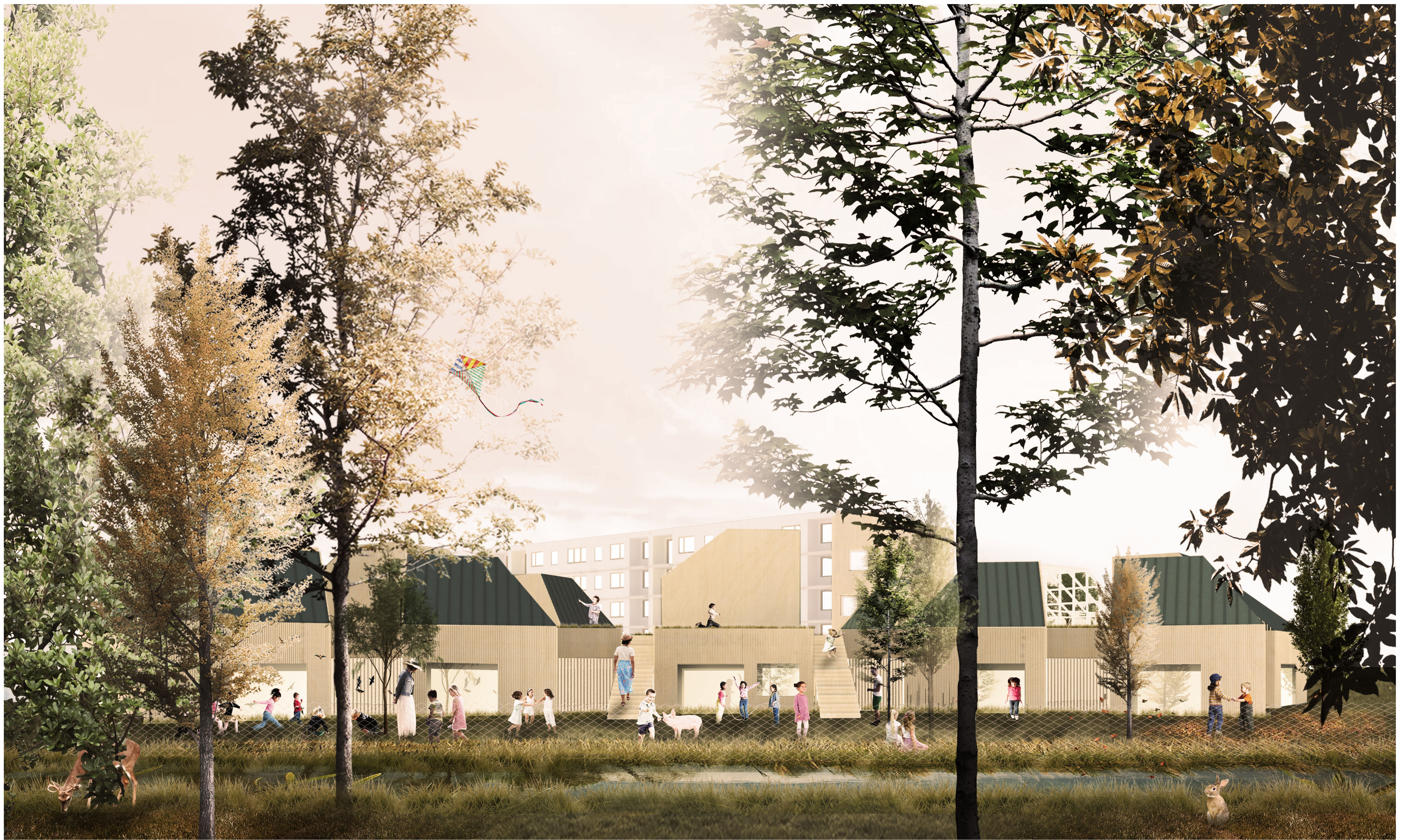
Pohled ze zahrady