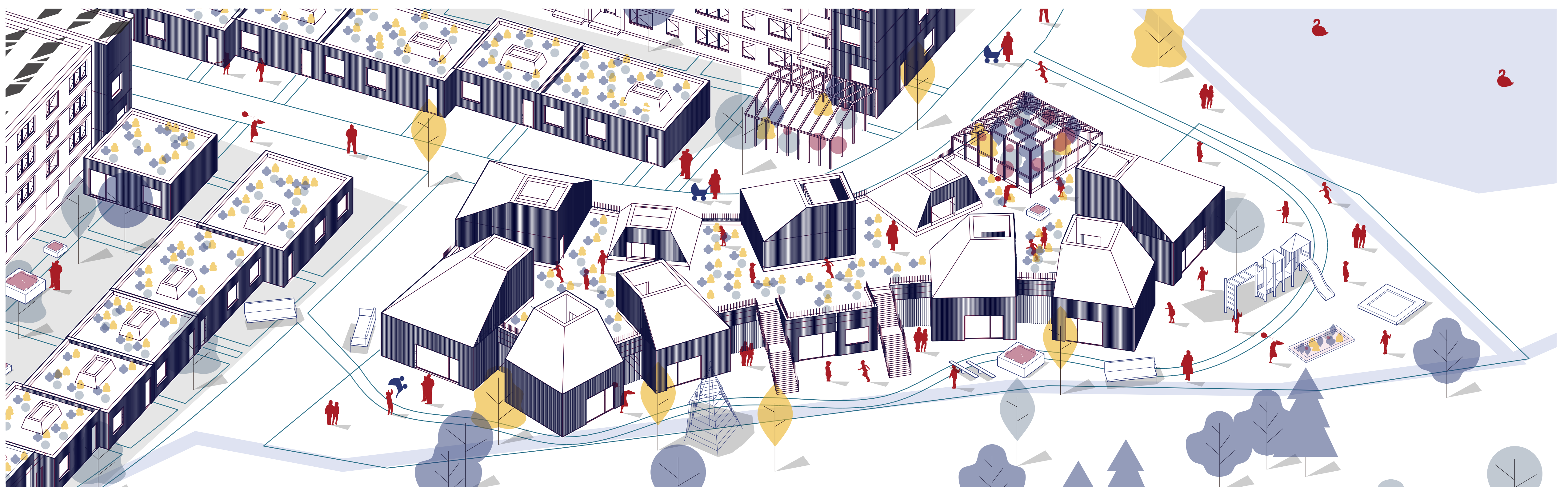
Návaznost školky na území