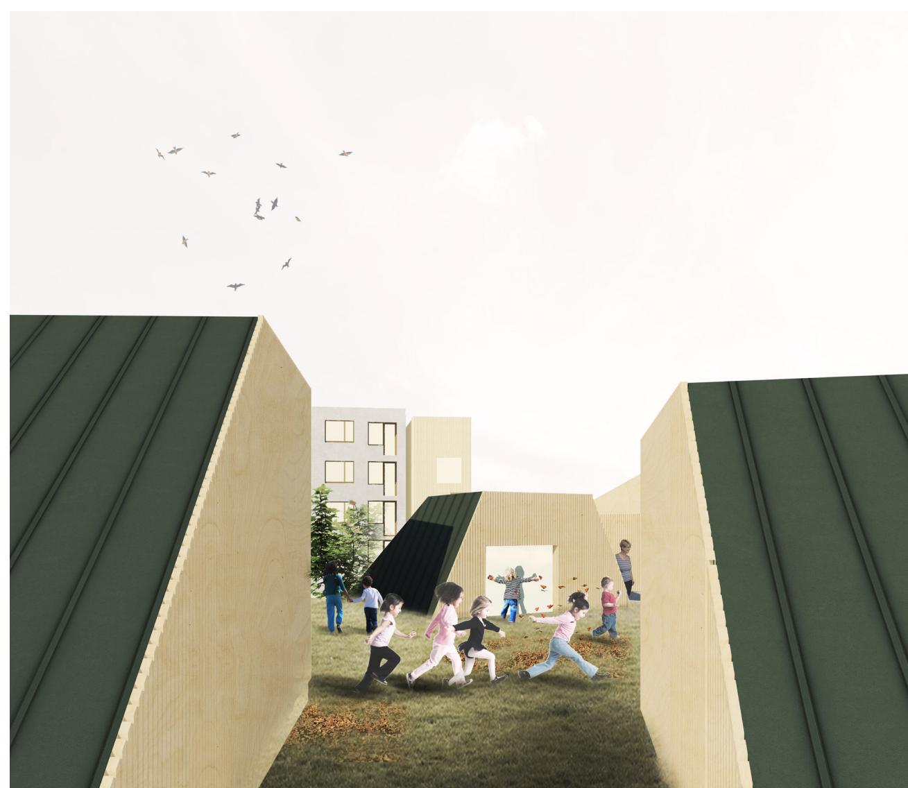
Střeška jako hřiště