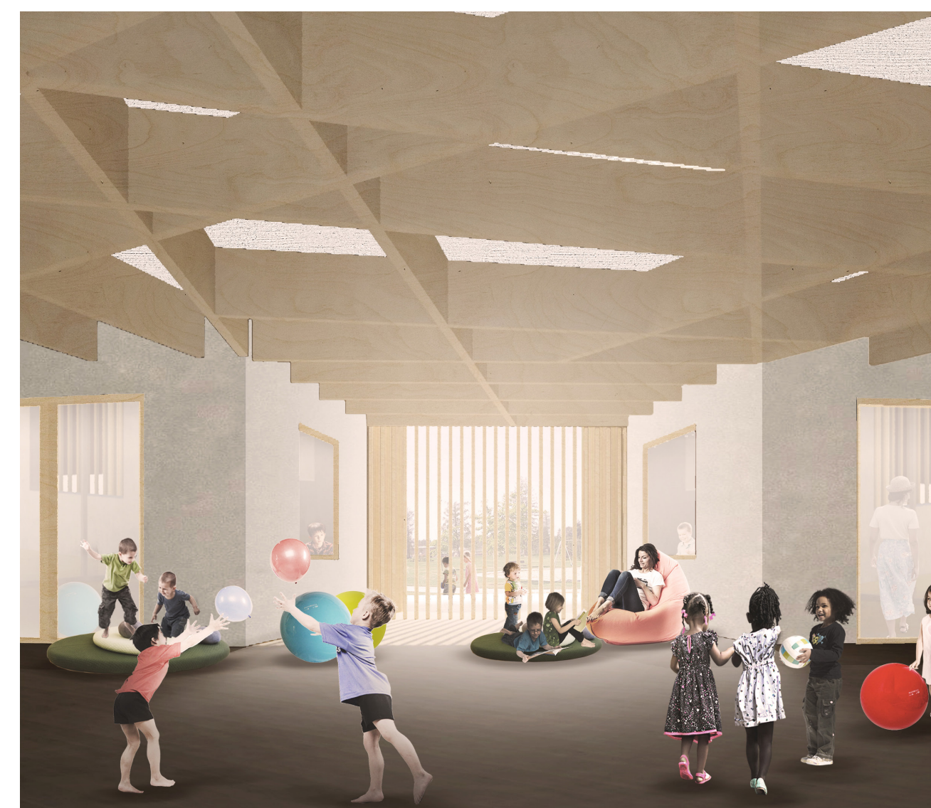
Interiér společného prostoru